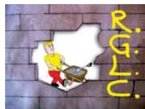
Edilizia Conte s.n.c. - Trani